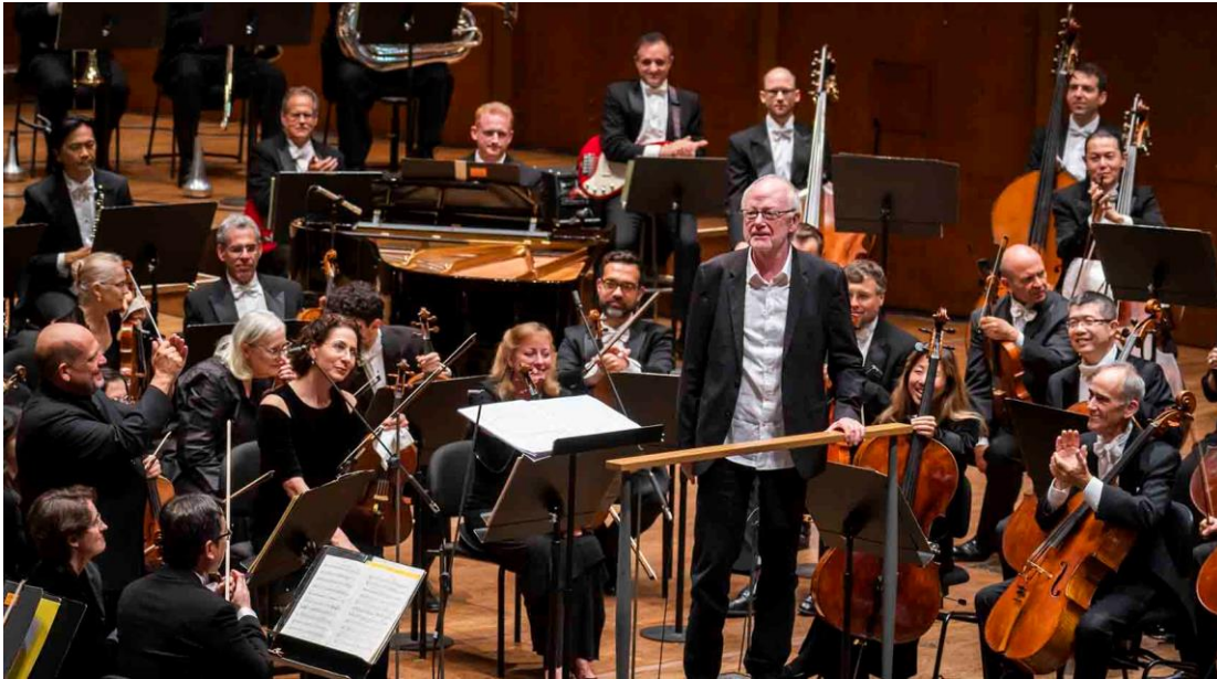
Componist Louis Andriessen hier voor het New York Philharmonic Orchestra olv Jaap van Zweden (2018)